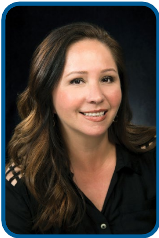
Adelita S. Grijalva Board President AdelitaGrijalva@gmail.com